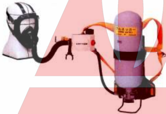
●ライフゼムK2シリーズ