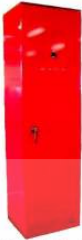
●移動式ホースリール（屋内用）