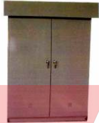
●ユニット型（屋外用）